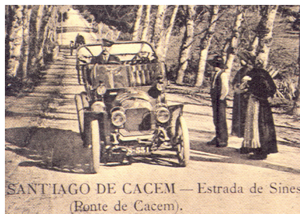
SANTIAGO DE CACEM — Estrada de Sines (Ponte de Cacem).

Os proprietários da freguesia de Santo André apresentaram-se na sessão de câmara de 24 de Março, para reivindicar a reparação da estrada de Sines, que se encontrava intransitável junto à ponte.