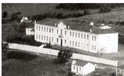
Hospital Conde do Bracial

A Misericórdia de Santiago do Cacém foi autorizada, por decreto de 21 de Maio, a