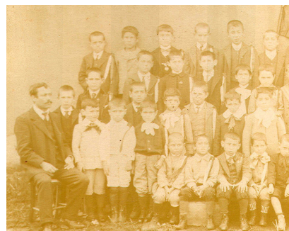
Grupo de alunos de uma escola do Concelho

pobreza, impediria muitos alunos de efectuarem o referido exame.