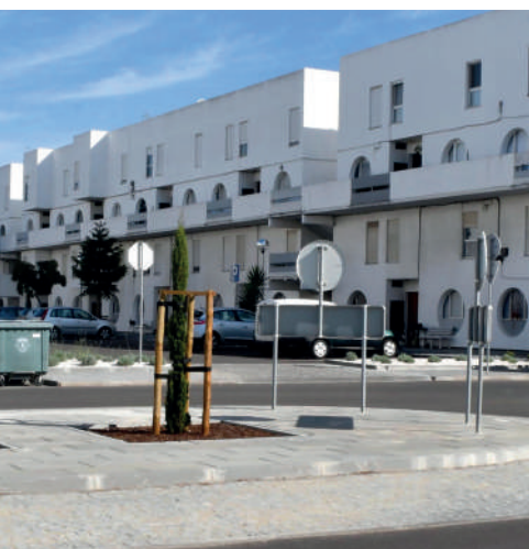
▲ Requalificação do Bairro do Pinhal em Santo André