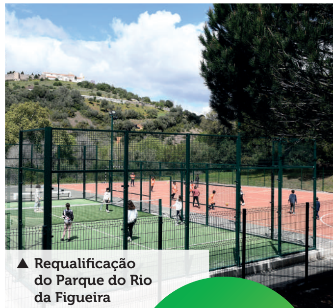
▲ Requalificação do Parque do Rio da Figueira