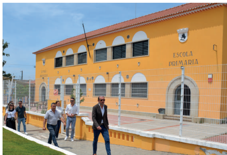
▲ Escola Básica do 1.º Ciclo de Ermidas-Sado requalificada