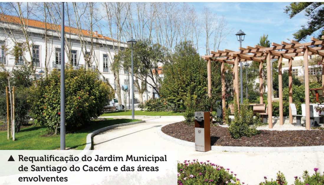
▲ Requalificação do Jardim Municipal de Santiago do Cacém e das áreas envolventes