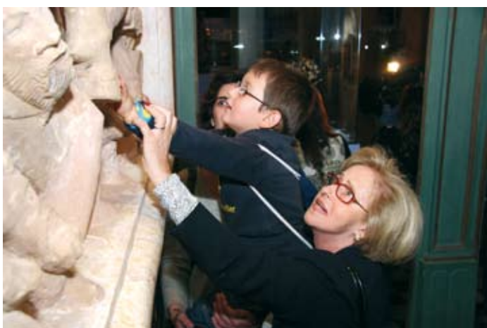
Centro Helen Keller de visita à exposição