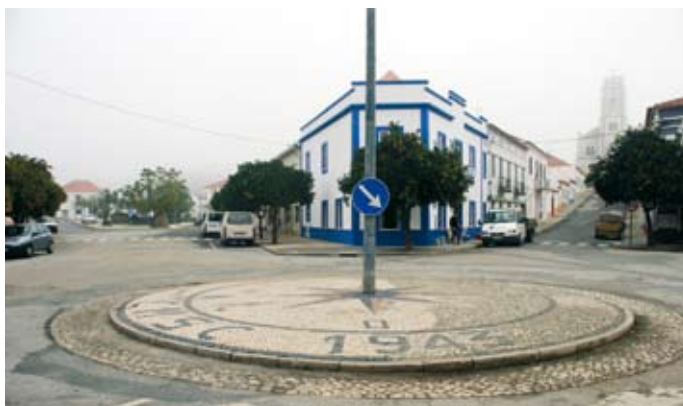
1 ano depois