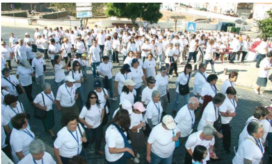
Mais de 500 pessoas reuniram-se na caminhada solidária

Numa organização do Núcleo de Senologia do Hospital do Litoral Alentejano e da Associação de Médicos do Litoral Alentejano, com o apoio da Câmara Municipal, decorreu entre 23 e 30 de Outu-