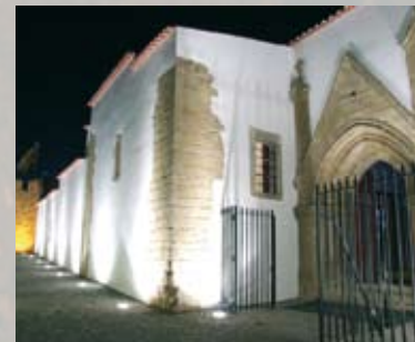
Suplemento da Exposição “No Caminho sob as estrelas”