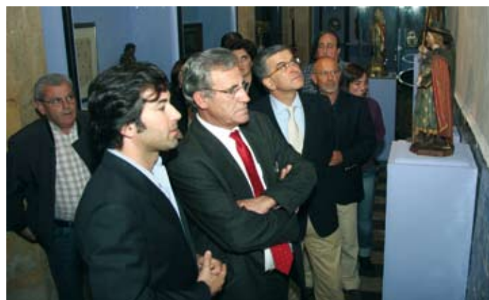
Visita do Secretário Geral do PCP, Jerónimo de Sousa