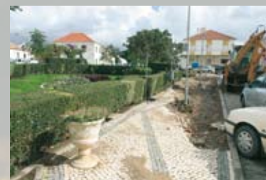
Cheias 2006 - um ano depois