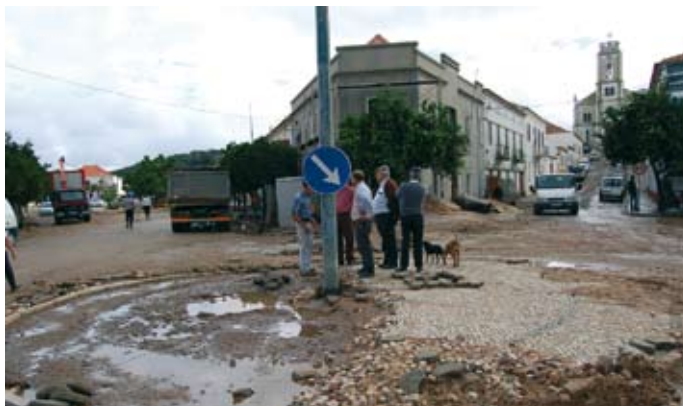
3 de Novembro de 2006

A única obra realizada pelo Estado depois das cheias de 2006 foi a reparação da Estrada Regional 390 junto a S. Domingos.