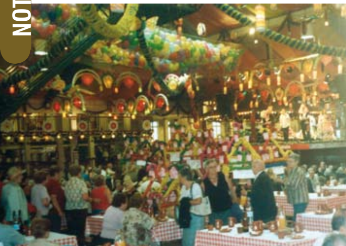
Arraial Minhoto proporciona momentos divertidos

A energia chega a ser contagiante e acaba por ser um exemplo para muitos preguiçosos. Os “menos jovens” das instituições de reformados do município voltaram este ano a aplicar-se a fundo no projecto “Sociabilidades” e a demonstrar que quem sabe nunca esquece. Foi assim entre os dias 26 de Setembro e 10 de Outubro, período em que decorreu um programa que visa comemorar o Dia Internacional das Pessoas Idosas, favorecer relações entre as várias ins-