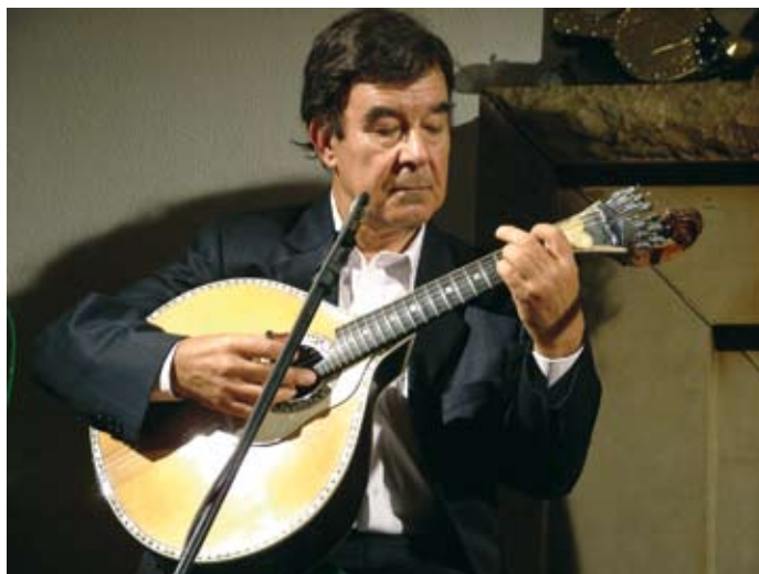
António Chainho distinguido com o Prémio Carreira

Guilherme Leite, Nicolau Breyner, Tim (Xutos e Pontapés) e o próprio António Chainho (também ele distinguido durante a noite com o “Prémio Carreira” na área da Cultura), para além de muitas outras individualidades ligadas à vida política, empresarial, desportiva e das artes e espectáculos. Sem dúvida, uma noite que elevou bem alto o nome do município de Santiago do Cacém e que ajudou a consolidar a sua projecção no Alentejo e no País.