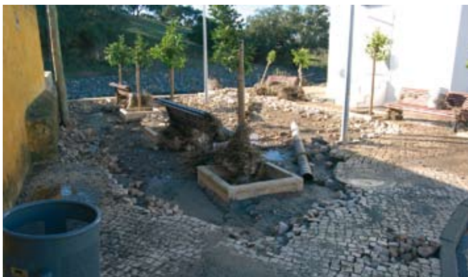
3 de Novembro de 2006