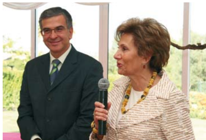
Dr.ª Maria Cavaco Silva de visita à exposição