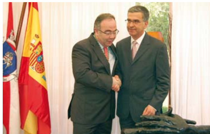
Assinado Acordo de Geminção com Santiago de Compostela

ganização foi tripartida entre a Autarquia, o Departamento de Património Histórico e Artístico da Diocese de Beja e o Governo Regional da Galiza, classificando a mostra como “qualquer coisa de extraordinário para o município, para a Região e até para Portugal”, focando o “carácter inédito” do acontecimento. Outro factor positivo foi “a vinda a Santiago do Cacém de muitas pessoas que ocupam cargos públicos, que levam o nosso nome para longe e vão com certeza recordarnos por boas razões”. O Presidente da República e a sua esposa, a Ministra da Cultura, Jaime Gama (Presidente da Assembleia da República), Embaixadores de vários países, o General Ramalho Eanes, Jerónimo de Sousa, Eusébio da Silva Ferreira, os catedráticos da Academia de Ciências, ou a Sociedade Histórica da Independência de Portugal, foram algumas das pessoas/instituições notáveis que visitaram a exposição e que demonstraram publicamente a sua admiração.