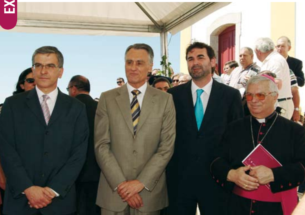
Inauguração da exposição “No Caminho sob as Estrelas” com a presença do Presidente da República