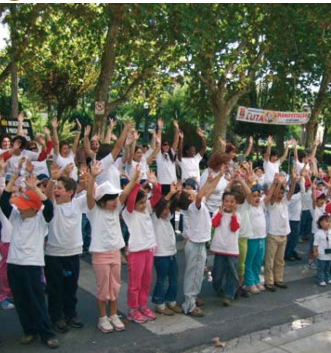
Os jovens de Santiago do Cacém levantaram a voz contra a pobreza

No dia 17 de Outubro, Dia Mundial para a Erradicação da Pobreza Extrema, a Câmara Municipal de Santiago do Cacém associou-se a esta iniciativa e convidou os jovens de Santiago do Cacém para juntarem a sua voz às milhares de pessoas que através de um acto simbólico, lembraram aos líderes mundiais os seus compromissos com a erradicação da Pobreza extrema, um dos objectivos de Desenvolvimento do Milénio.