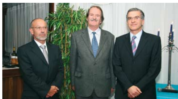
D. Duarte Pio, Duque de Bragança visitou a exposição