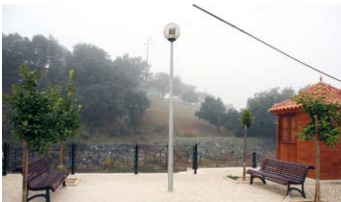
1 ano depois