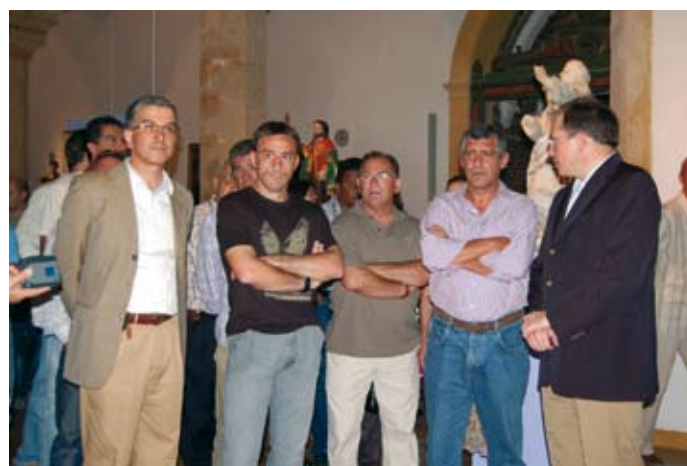
Paulo Bento e Fernando Santos "No Caminho Sob as Estrelas"