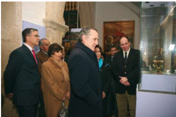
A exposição recebeu o General Ramalho Eanes e o Embaixador do Perú