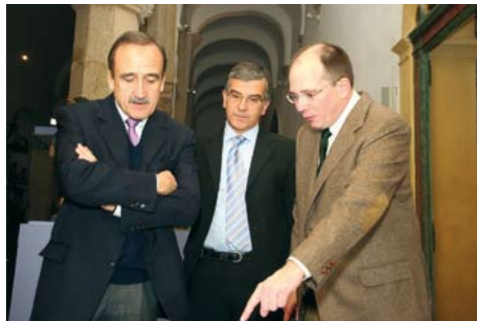
Embaixador de Espanha veio conhecer a exposição