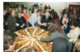
Dia dos Reis comemorado pelos idosos

A Câmara Municipal ofereceu aos presentes o tradicional Bolo Rei que pesava nada mais, nada menos que 42 kg.