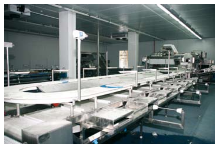
Uma fábrica altamente automatizada e com as últimas tecnologias disponíveis