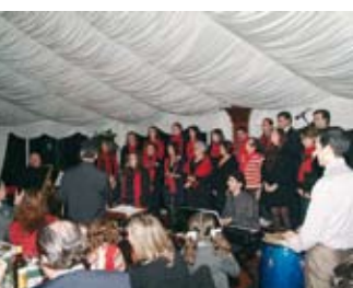
Jantar de Natal animado pelo Coral de trabalhadores

No município de Santiago do Cacém a autarquia promoveu iniciativas para assinalar o Natal, com destaque para o jantar que reuniu cerca de 374 trabalhadores da Câmara Municipal e seus familiares.