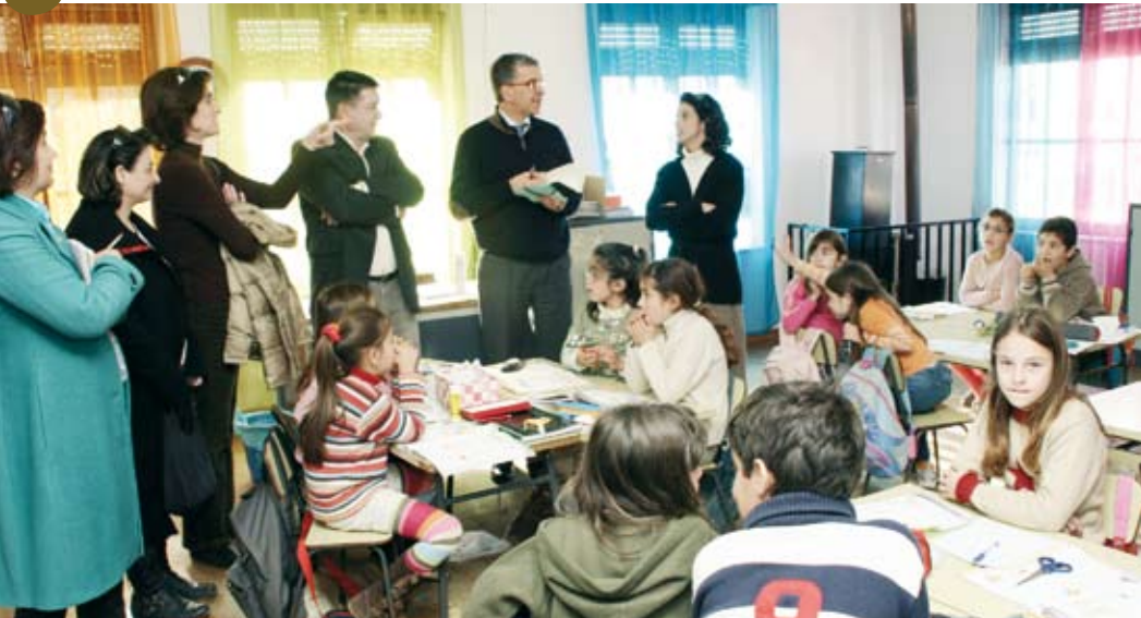
Presidente visita Escola Básica (EB1) do Arealão