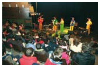
Festa de Natal do Pré-escolar

Para os mais pequenos que frequentam os jardins-de-infância do município, a Câmara Municipal ofereceu a peça “Um Conto na Floresta” e livros didáticos, estes últimos foram também oferecidos aos alunos do 1.º ciclo.