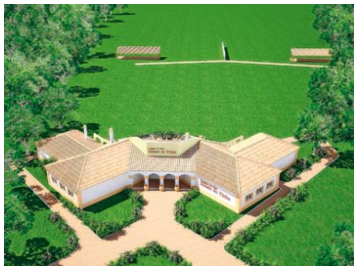
Vista Aérea do futuro Campo de Tiro do Monte da Vinha em Alvalade

Com uma área de 3 hectares, está a ser construído, na freguesia de Alvalade, um empreendimento com as vertentes de animação turística, lazer, desporto e entretenimento, para a prática do desporto de Tiro aos Pratos.