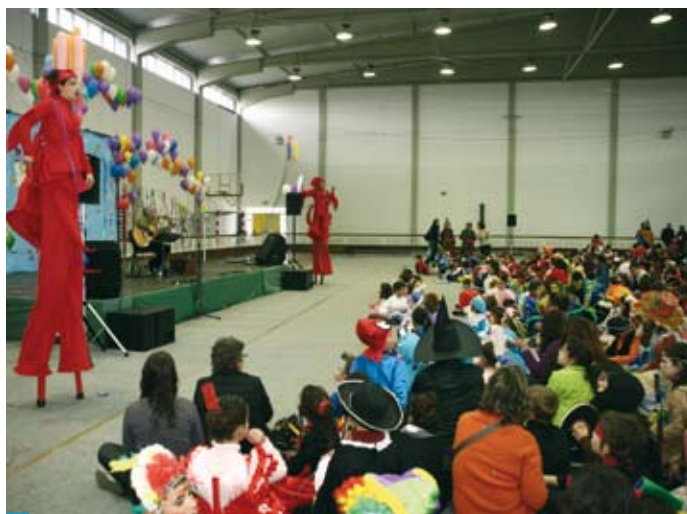
Santiago do Cacém

diversão entre este grupo etário. A iniciativa “Baile de Máscaras” proporcionou a muitos dos participantes a primeira ida à Discote-