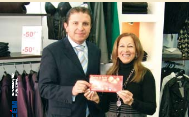
Entrega do 1.º prémio à Trigo Limpo, Santiago do Cacém

Realizou-se entre 4 e 26 de Dezembro, em Vila Nova de Santo André e Santiago do Cacém a iniciativa "Montras de Natal". Promovida pela Câmara Municipal tem por objectivo distinguir algumas montras de acordo com critérios definidos pelo júri, que durante quatro dias apreciou as vitrinas e distinguiu os seguintes estabelecimentos comerciais: 1.º - Trigo Limpo, 2.º - Nelbet -Santo André, 3.º- HR design, 4.º - Tudóptica e em 5.º - O Malmequer.