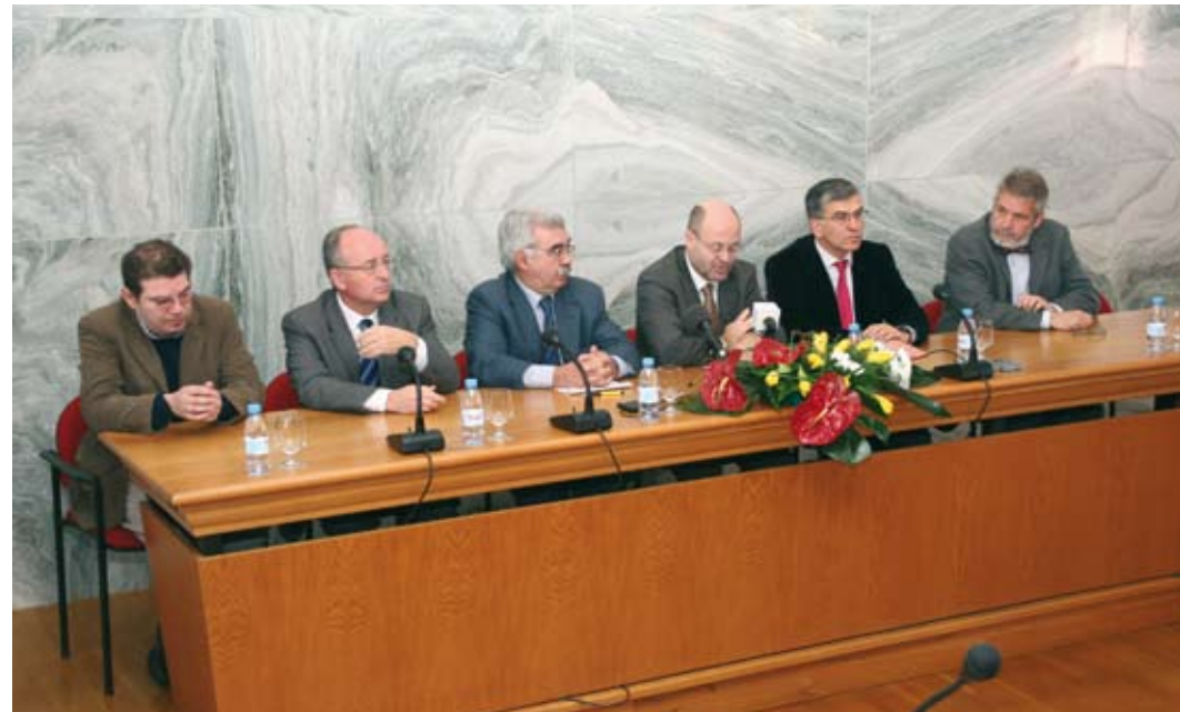
O GISA está orçado em um milhão e 183 mil euros e o protocolo tem a duração de 36 meses.