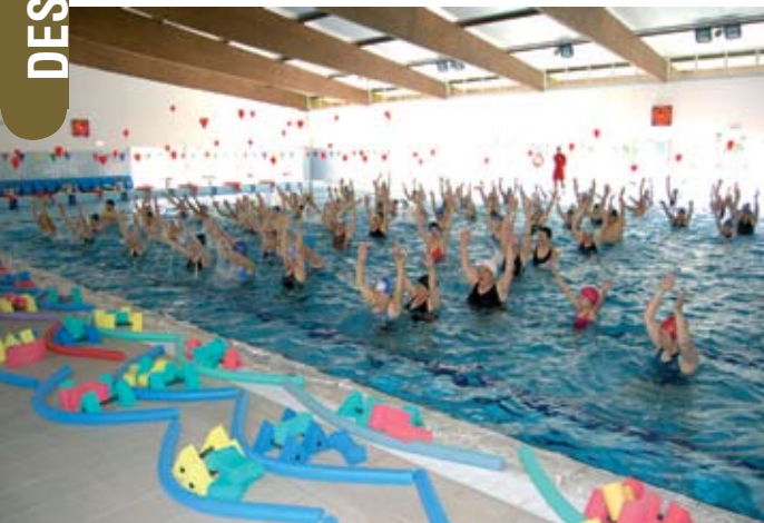
Actividade para assinalar o mês do coração e de promoção da prática desportiva

Quando é que repetimos esta iniciativa? Perguntava um dos participantes à saída da Mega Aula de Hidroginástica, que decorreu no dia 25 de Maio, nas Piscinas Municipais. Uma actividade para assinalar o mês do coração e de promoção da actividade desportiva em meio aquático.