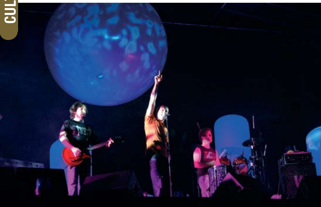
2.500 pessoas vibraram com o concerto dos Pólo Norte na Praça Zeca Afonso

Ano após ano, a população do município de Santiago do Cacém faz questão de assinalar a conquista da Democracia em Portugal, e já foi há 34 anos. Este ano não foi diferente e o povo voltou a sair à rua com entusiasmo.