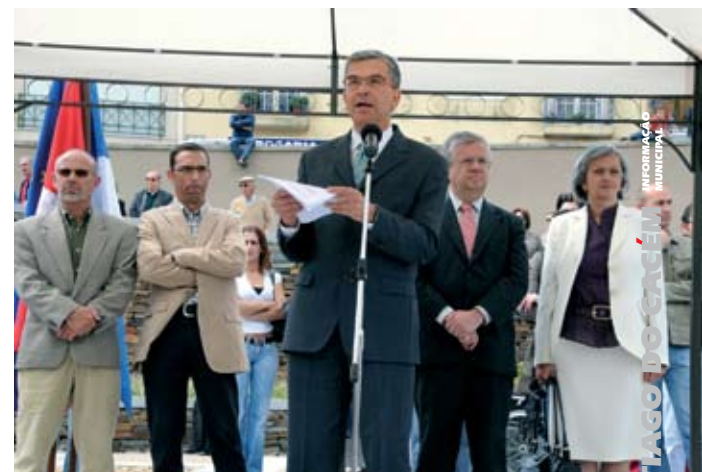
Presidente da Câmara Municipal no uso da palavra