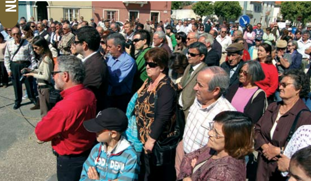
Centenas de pessoas estiveram na inauguração do Museu do Trabalho Rural

Foi na presença de centenas de pessoas que o Museu do Trabalho Rural de Abela inaugurou no dia 1 de Maio, Dia Internacional do Trabalhador. Iniciativa da Junta Freguesia de Abela em parceria com a Câmara Municipal, integrado no projecto "Revitalizar A Bella" apoiado pelo Programa Operacional AGRIS, Leader e Caixa Agrícola da Costa Azul.