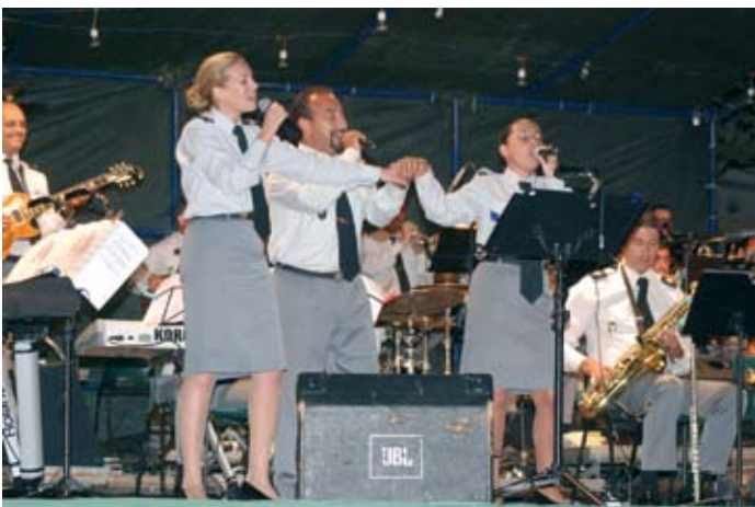
Orquestra Ligeira do Exército levou ao rubro a Vila do Cercal do Alentejo

Um município ao rubro, turistas muito bem impressionados e muita juventude de “a curtir”. Foi assim em Santiago do Cacém, com Pedro Abrunhosa, em Vila Nova de Santo André – com os Da Weasel, bem como no Cercal do Alentejo com a Orquestra Ligeira do Exército.