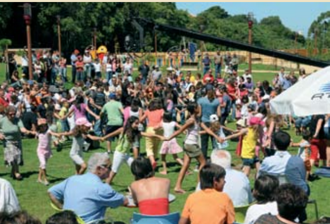
A interação com o público foi constante durante o programa