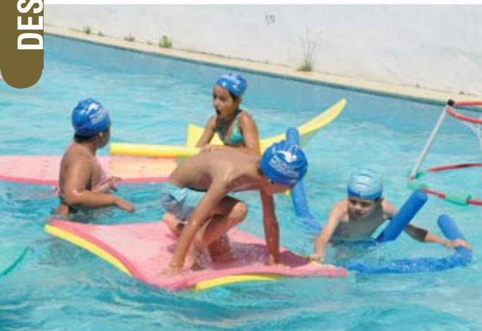
Actividades nas piscinas descobertas