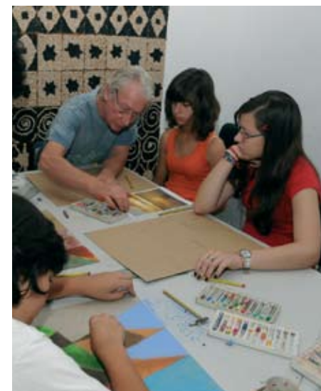
Atelier de Pintura no Museu Municipal

É divertido, giro. Gosto dos professores. Se puder para a próxima volto.