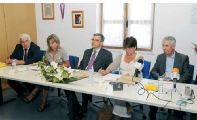
Cerimónia de assinatura do protocolo entre a Santa Casa da Misericórdia, a ARS do Alentejo e o Centro Distrital de Segurança Social.

A Santa Casa da Misericórdia de Santiago do Cacém celebrou um protocolo no dia 26 de Agosto com a Administração Regional de Saúde do Alentejo e com o Centro Distrital de Segurança Social para dar resposta a 22 utentes da nova Unidade de Longa Duração e Manutenção. Um espaço que funciona há vários anos, mas que só agora e depois de ultrapassadas barreiras da burocracia foi possível inaugurar.