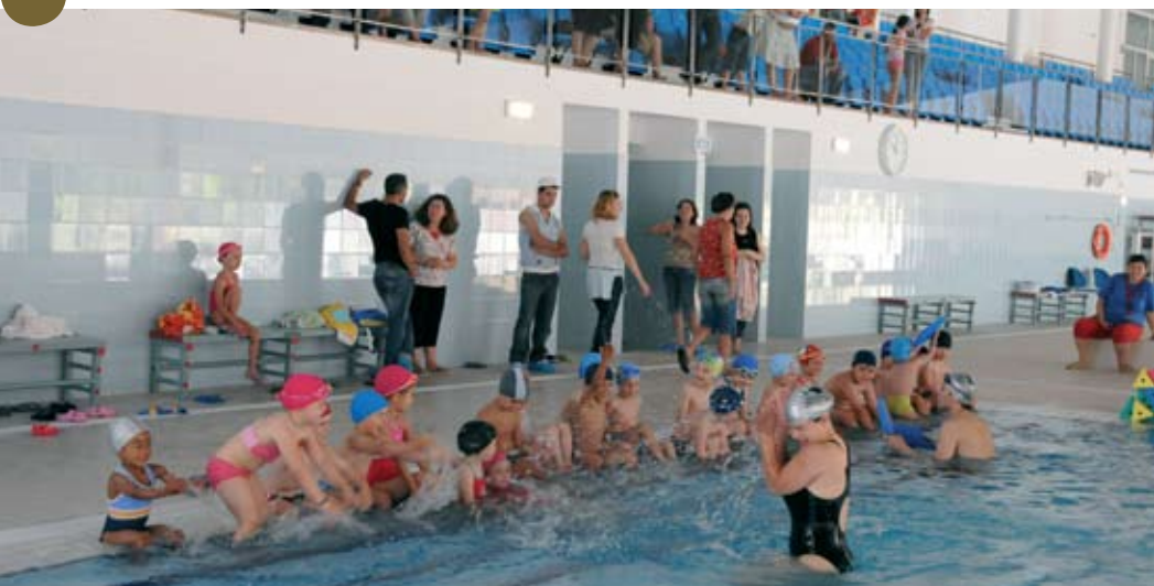
Estiveram presentes na iniciativa 93 alunos de todos os escalões

Realizou-se no dia 22 de Junho o 2º Festival de Encerramento das Actividades da Escola Municipal de Natação das Piscinas Municipais de Santiago do Cacém.