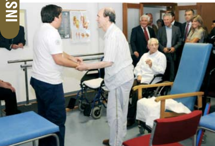
As entidades presentes visitaram as instalações da nova unidade de cuidados continuados