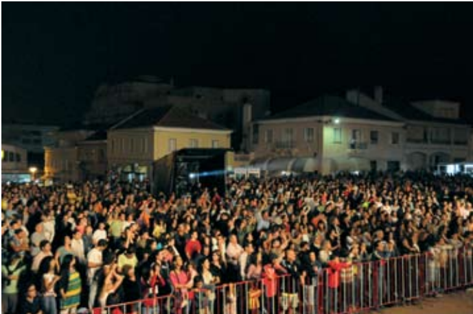
Milhares de pessoas vibraram com os êxitos de Pedro Abrunhosa