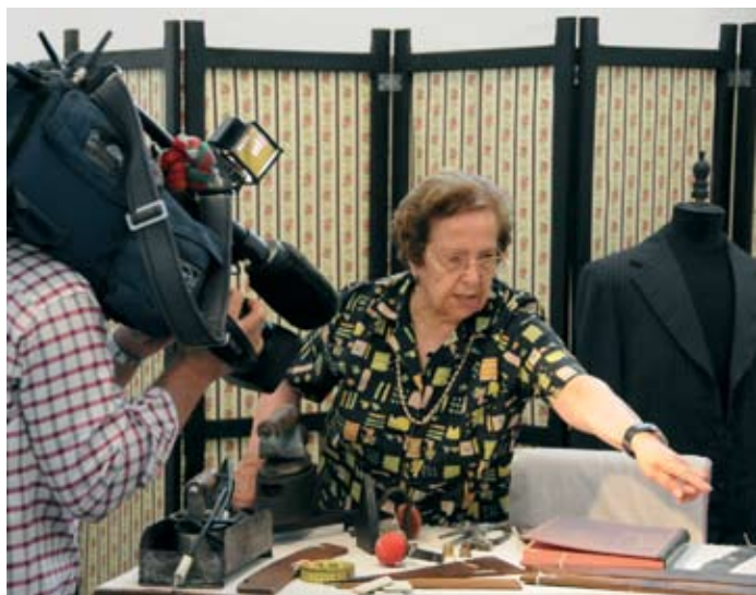
O tema, profissões em vias de extinção, despertou o interesse do programa da RTP, Portugal em Directo

A Câmara Municipal de Santiago do Cacém vai oferecer os dois cadernos do património, apresentados no dia 7 de Junho, no Museu Municipal. O anúncio foi feito pelo Presidente da Câmara Municipal perante uma sala cheia de convidados e intervenientes nos dois cadernos do