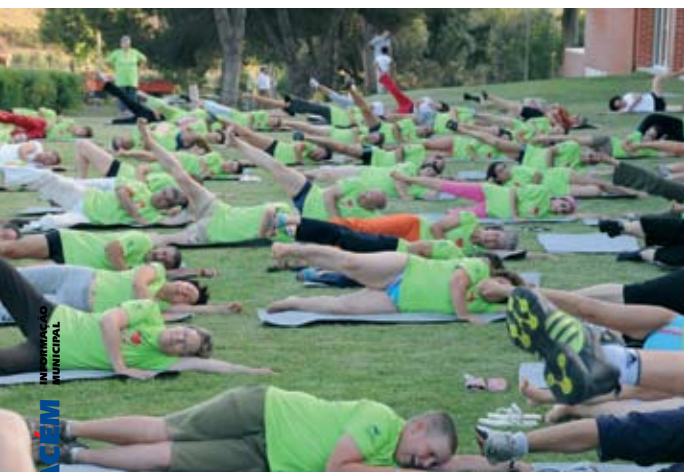
Super Aula de Hidroginástica e Ginástica Localizada

de Verão, de terça a sexta-feira, entre as 10h00 e as 12h30, onde as crianças e jovens participam em várias actividades e jogos aquáticos (voleibol, basquetebol, pólo e circuitos dentro de água). Esta actividade envolve 170 participantes.