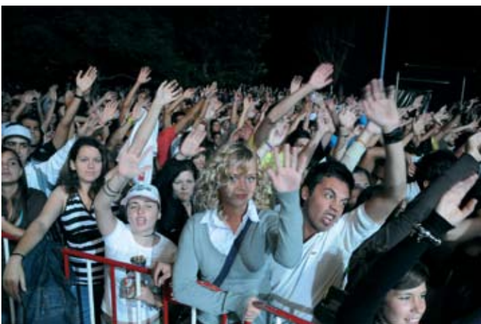
Muita energia do princípio ao fim no concertos dos Da Weasel