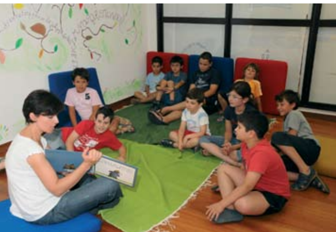
Ateliers nas Bibliotecas