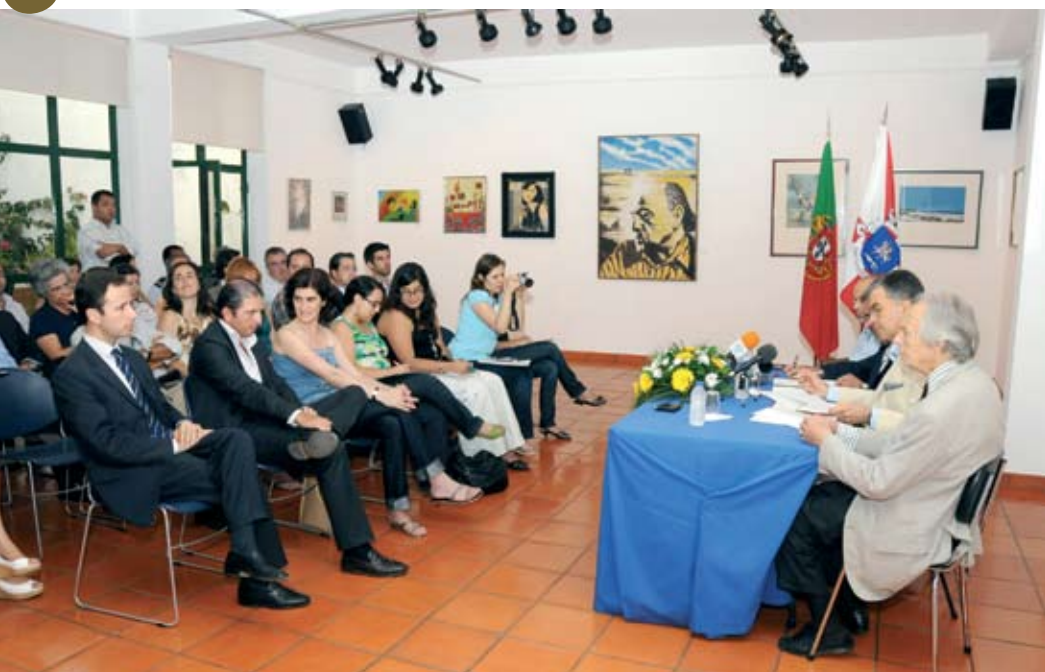
Cerimónia de assinatura do protocolo com o Instituto Superior Técnico