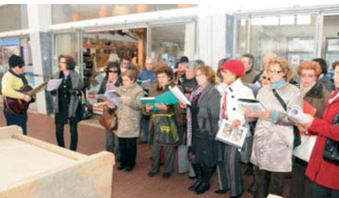
TUNASAS (Santo André) empenhada nas janeiras

O Programa da RTP “Portugal no Coração” dedicou o programa do dia 8 de Janeiro, à Festa dos Reis organizado pela Câmara Municipal e dedicado aos idosos.