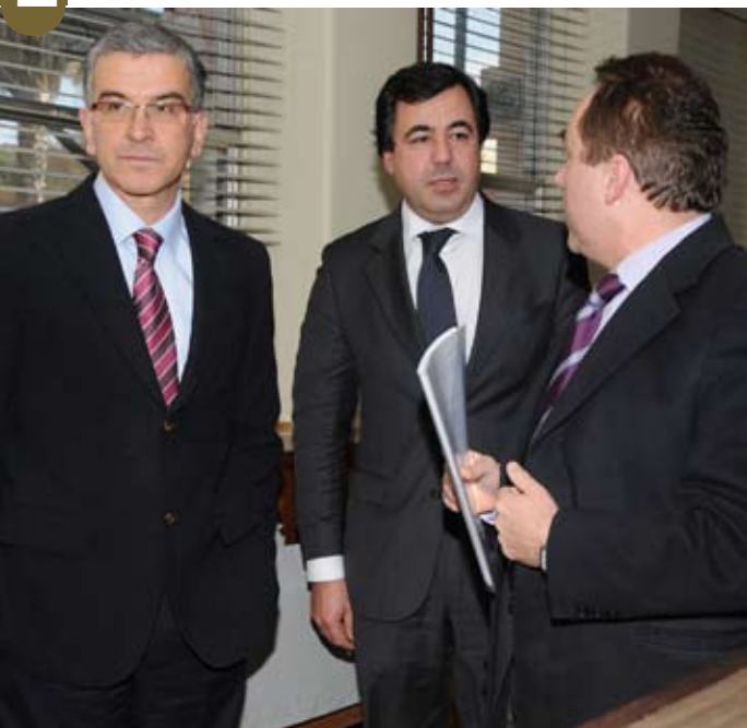
Presidente da Câmara Municipal com o Secretário de Estado da Justiça