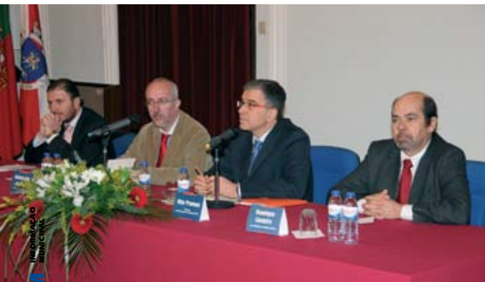
Encontro com vários operadores turísticos do Concelho