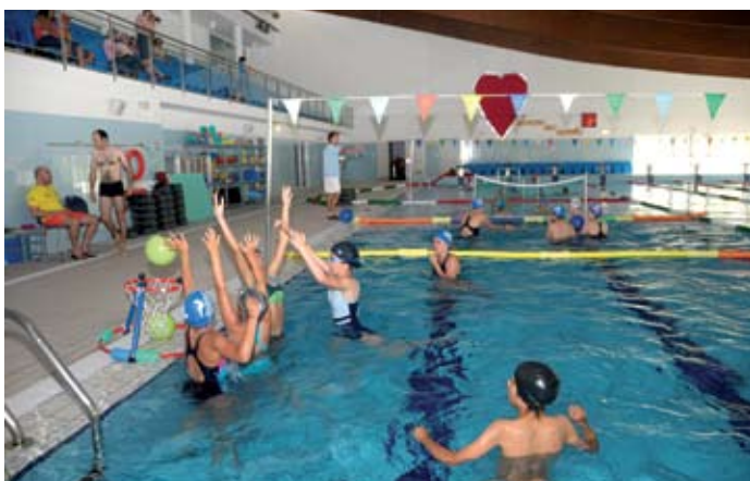
Jovens participaram no festival de encerramento da época 2008/2009

As Piscinas Municipais de Santiago do Cacém continuam com uma actividade intensa e a movimentar centenas de atletas e praticantes todos os dias. As iniciativas também são uma constante e nas últimas semanas ficaram muitas histórias para contar.