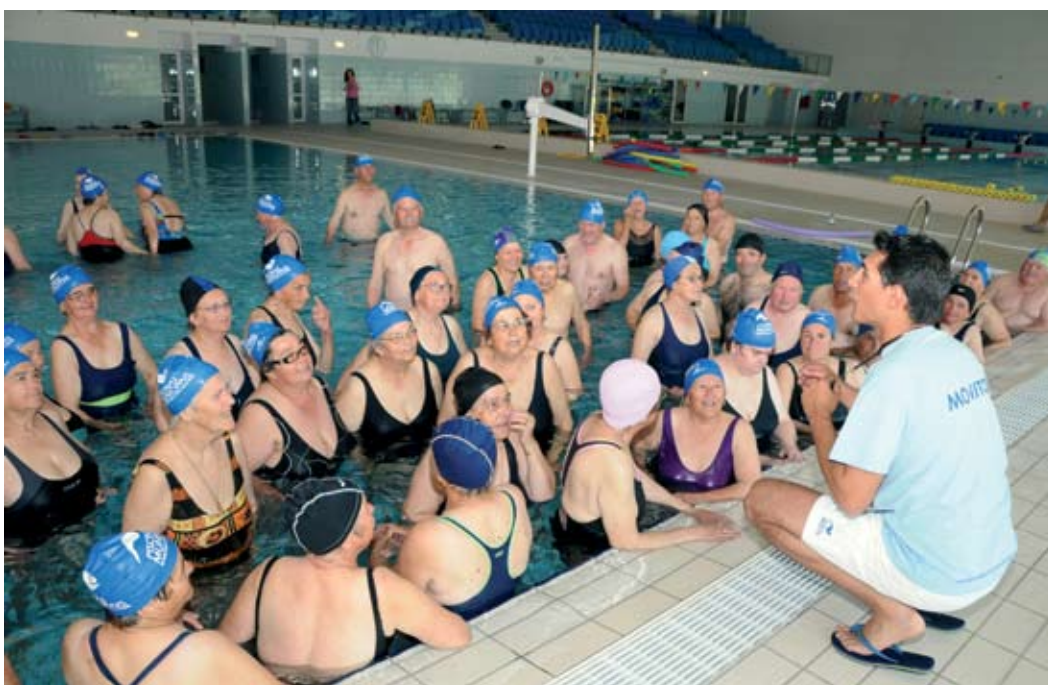
4.º encontro de Sénior activo