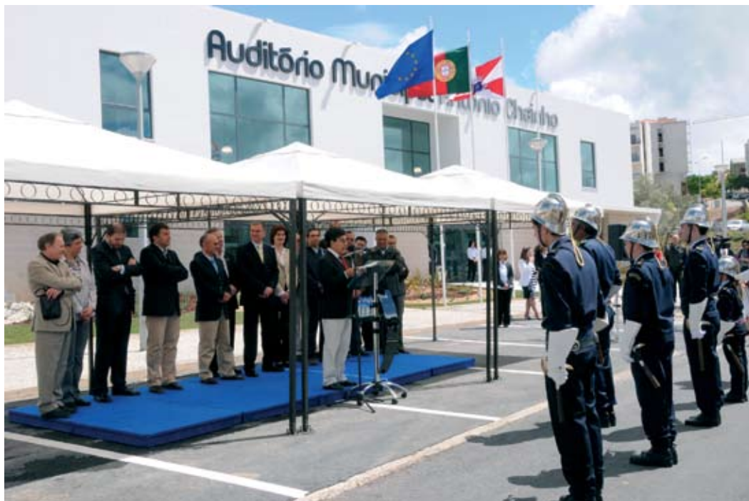
Presidentes da Câmara e Assembleia Municipal acompanhados pelos vereadores e presidentes de Junta homenagearam António Chainho

O dia 23 de Maio, marcou a história de Santiago do Cacém, foi inaugurado o Auditório Municipal do município, que teve como patrono António Chainho, o Mestre da Guitarra Portuguesa. Este novo equipamento cultural do concelho orçado em 1.063.464,81€ tem capacidade para 242 pessoas.