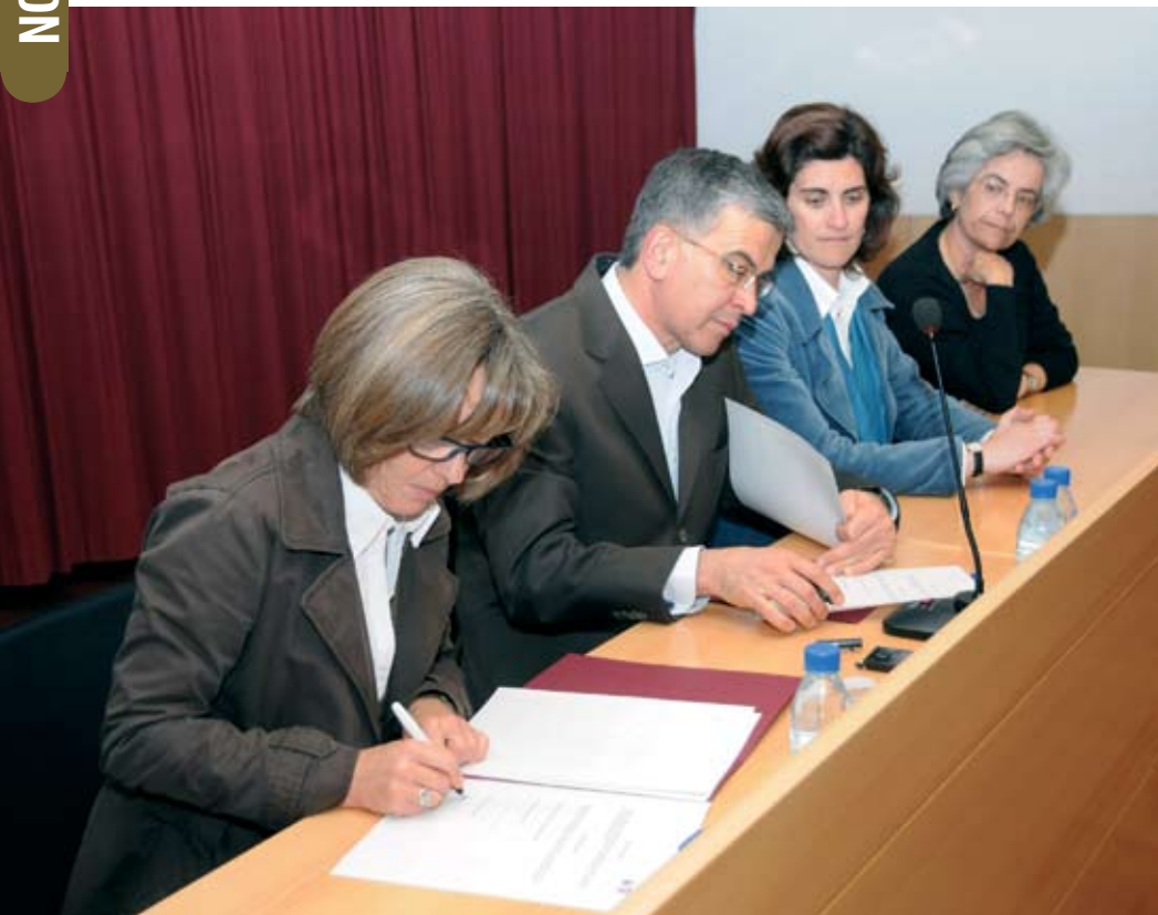
Cerimónia de assinatura do protocolo celebrado entre a Câmara Municipal e a Quadricultura Associação

A Câmara Municipal de Santiago do Cacém e a Quadricultura Associação, assinaram um protocolo de colaboração que estabelece os termos e condições em que é feita a parceria com vista à prossecução de actividades de interesse cultural a realizar na área do concelho de Santiago do Cacém, sob as designações de “Cextas de Cultura” e “Jazz Além Tejo”.