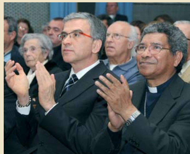
Dom Ximenes Belo, prémio Nobel da Paz, visitou Santiago do Cacém

Dom Ximenes Belo, Prémio Nobel da Paz, esteve em Santiago do Cacém a convite da paróquia de Santiago do Cacém no âmbito das comemorações do Septenário de Nossa Senhora das Dores.