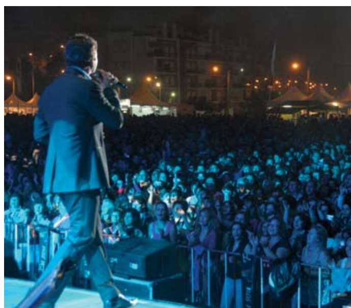
Espectáculo de Tony Carreira com milhares de pessoas