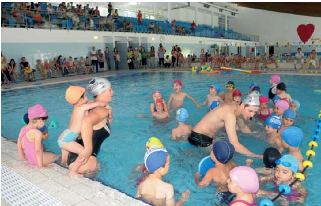
Demonstração da classe de Adaptação ao meio Aquático (3/5 anos)