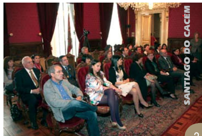
A cerimónia decorreu na presença dos conselheiros galegos de todas as forças políticas e do Chanceler do Consulado-geral de Portugal na Galiza

A geminação prevê uma estreita colaboração tendo em vista o crescente bem-estar social, traduzido nas acções conjuntas e em projectos comuns que promovam o intercâmbio cultural, turístico e económico entre os dois territórios.