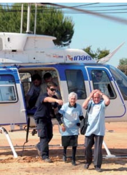
Cerca de 200 baptismo de voo proporcionados aos idosos

Os espectáculos, Roxinol Faduncho, João Pedro Pais, Santa Maria e Tony Carreira contaram com “casa cheia” e com o entusiasmo do público, para isso contribuiu a grande qualidade dos mesmos.