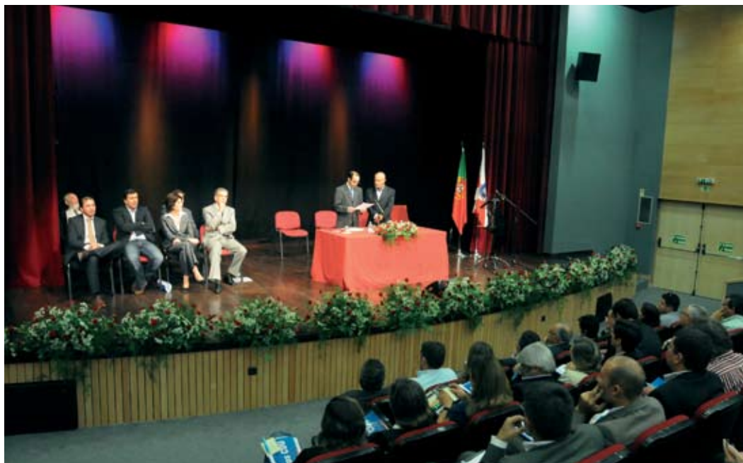
Tomada de posse dos novos órgãos autárquicos eleitos para o Município de Santiago do Cacém

A cerimónia solene de tomada de posse dos órgãos autárquicos de Santiago do Cacém decorreu no dia 30 de Outubro, no Auditório Municipal António Chainho.