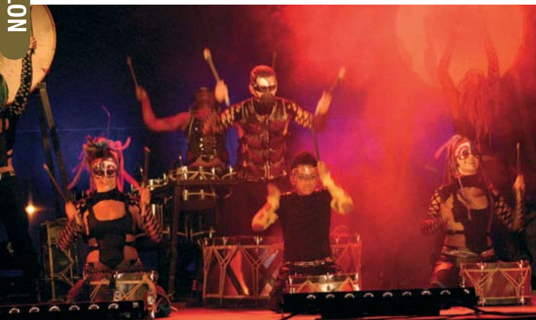
Espectáculo “WoK” dos Toca a Rufar

Durante o mês de Setembro o aniversário foi assinalado com um conjunto de iniciativas em torno da animação, do teatro, da música, do livro, da leitura e de várias vertentes que são trabalhadas ao longo do ano pela Biblioteca.