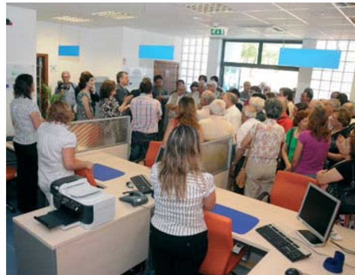
População de Santo André presente no dia da inauguração

O Gabinete Municipal de Santo André foi inaugurado no dia 4 de Julho.