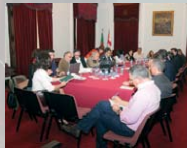
Reunião com a Refer para apresentação de alternativas