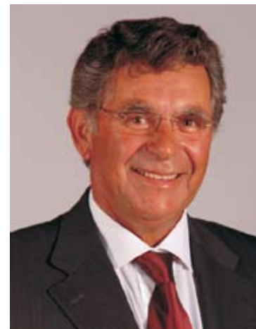
Assembleia Municipal Ramiro Beja CDU