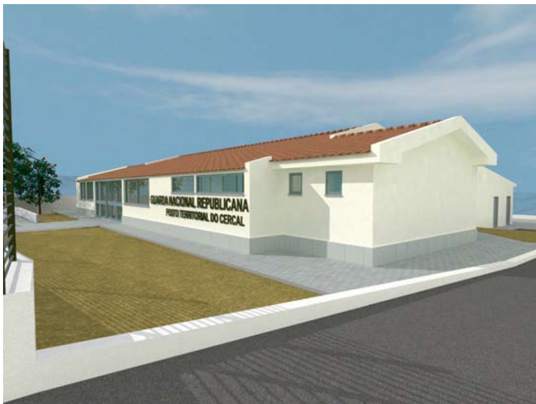
Antevisão das futuras instalações do Quartel da GNR do Cercal

Segundo o Presidente da Câmara Municipal, a autarquia assim que teve conhecimento do estado de degradação do actual edifício da GNR no Cercal, disponibilizou-se de imediato para ceder as instalações da escola que foi desactivada. "A GNR do Cercal vai finalmente ter um local ajustado à sua actividade, dotado de condições de funcionalidade e