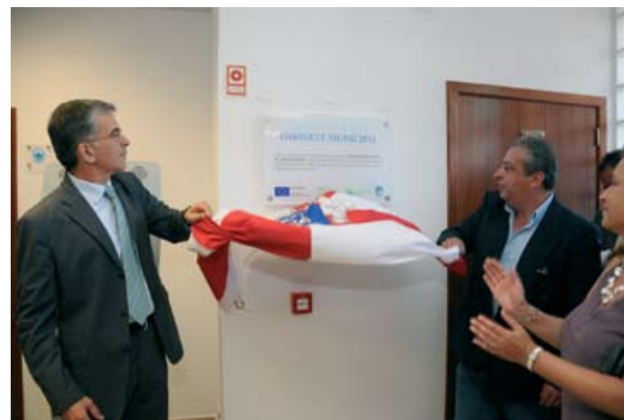
Presidentes da Câmara Municipal e Junta de Freguesia no descerrar da placa inaugural

"Tendo-me dirigido esta manhã ao gabinete municipal de Santo André, fiquei muito satisfeita não só com o serviço mas também com o espaço, e pensei: