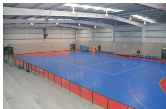
Novo Pavilhão Municipal em Santo André

A gestão do Complexo Desportivo do Campo Municipal de Futebol e do Pavilhão Municipal de Desportos ficará a cargo do Estrela de Santo André.