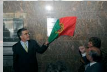
Santiago do Cacém com sede do Tribunal da Comarca do Litoral Alentejano

SANTIAGO DO CACÉM. Aposta na modernidade.