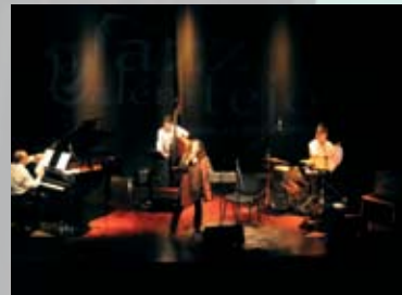
Festival Jazzalémtejo um sucesso