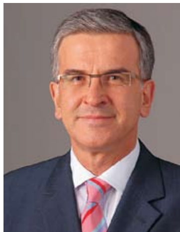
Câmara Municipal Vitor Prouença CDU