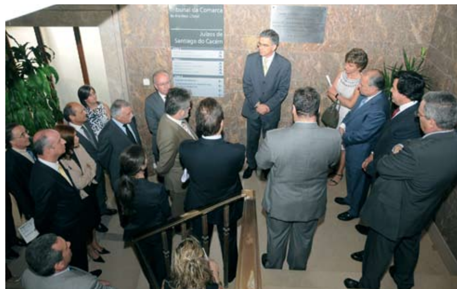
Ao lado da Juiz Presidente e de membros do Governo, Presidente da Câmara Municipal presente na inauguração do remodelado Palácio da Justiça

A autarquia colaborou com o Ministério da Justiça em todo o processo assumindo as obras dos arranjos exteriores.