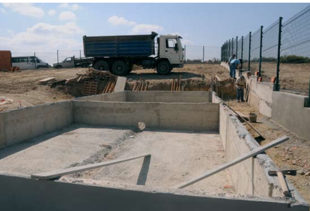
Nova Estação de Tratamento de Águas Residuais de Vale das Éguas, construída pela Câmara Municipal

Santiago do Cacém é um dos 23 municípios do Alentejo que decidiram integrar o Sistema de Parceria Pública Integrada com o Estado/ADP (Águas de Portugal), sendo criada uma Associação de Municípios e uma empresa para gerir o projecto.