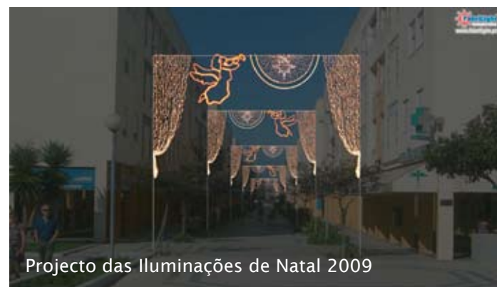
Projecto das Iluminações de Natal 2009

O período do Natal não deixa ninguém indiferente. É a festa de confraternização da família e uma data profundamente respeitada como momento alto e sublime do entendimento entre as pessoas.