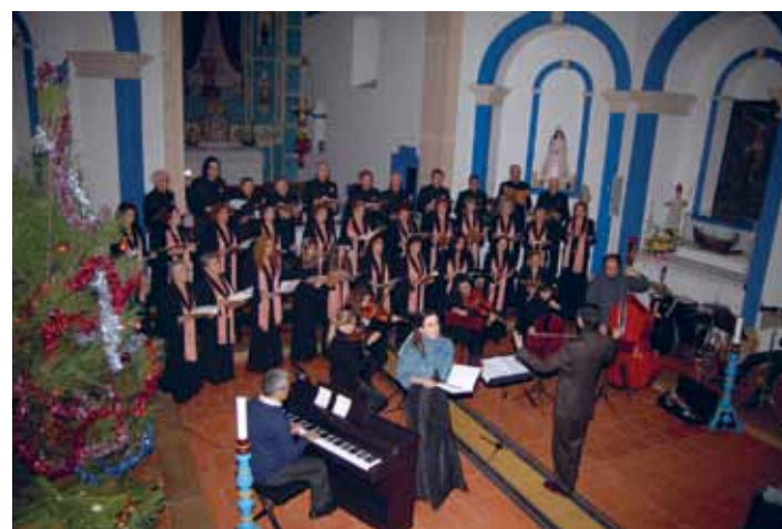
Coral do Clube Galp Energia