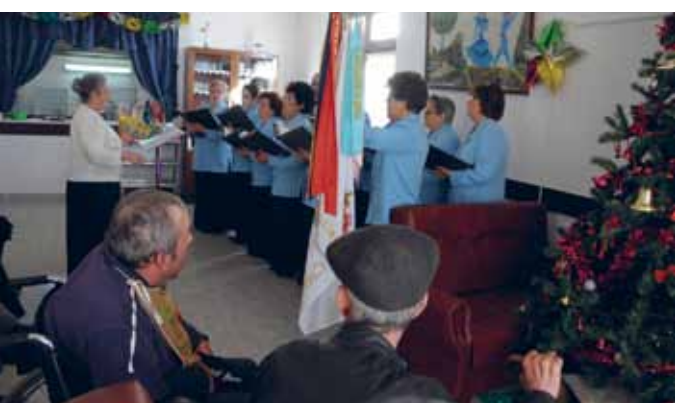
Coral de Santa Maria da Santa Casa da Misericórdia

A Câmara Municipal promoveu nas várias freguesias do concelho os Tradicionais Concertos de Natal e Ano Novo, em colaboração com os grupos do concelho. Iniciativa que arrancou no início do mês de Dezembro e que se prolongou até Janeiro.