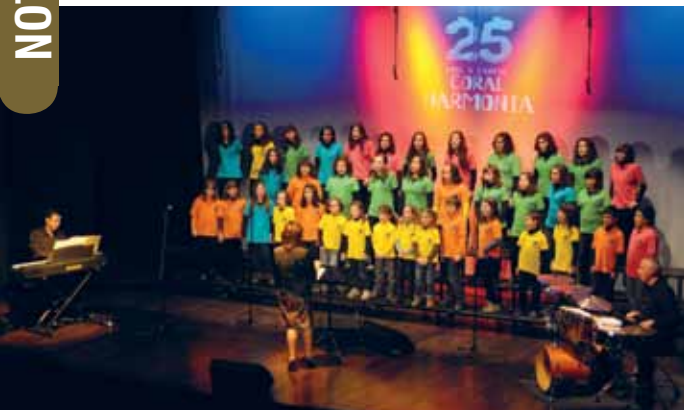
Coral Harmonia Juvenil