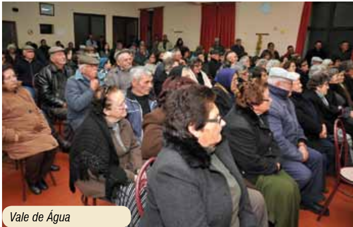
Vale de Água