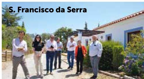
S. Francisco da Serra