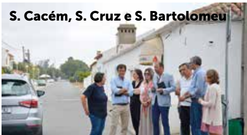
S. Cacém, S. Cruz e S. Bartolomeu