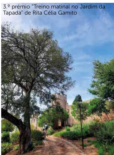
3.º prémio "Treino matinal no Jardim da Tapada" de Rita Célia Gamito