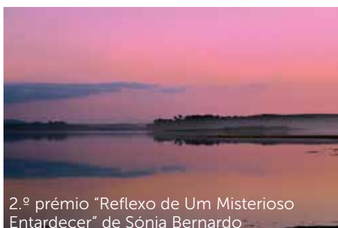
2.º prémio "Reflexo de Um Misterioso Entardecer" de Sónia Bernardo