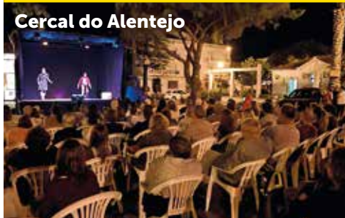
Cercal do Alentejo