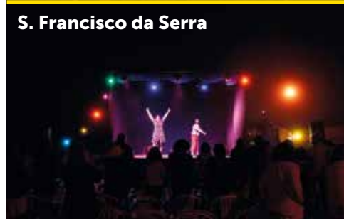
S. Francisco da Serra