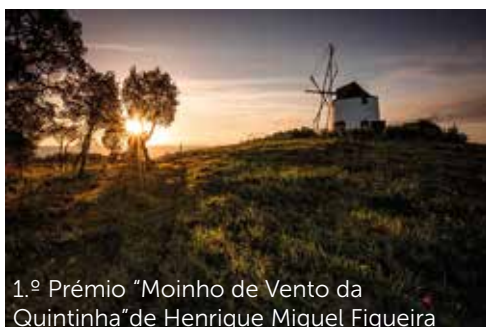
1.º Prémio "Moinho de Vento da Quintinha" de Henrique Miguel Figueira

Fotografias vencedoras da VI edição do Concurso de Fotografia.