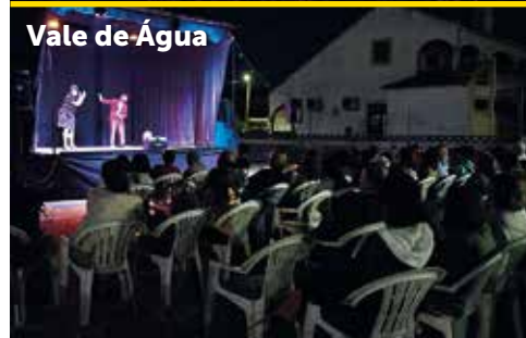
Vale de Água

No mês de agosto o teatro regressou às Freguesias com a peça "Tiempos Viejos" pela Companhia TanTonTería. Esta peça integrou o projeto Litoral Encena, uma parceria da AJAGATO com a Câmara Municipal de Santiago do Cacém. Tudo começa com José, que foge de sua residência para realizar um sonho que jamais poderia realizar: pular de paraquedas. Assim, ele quer