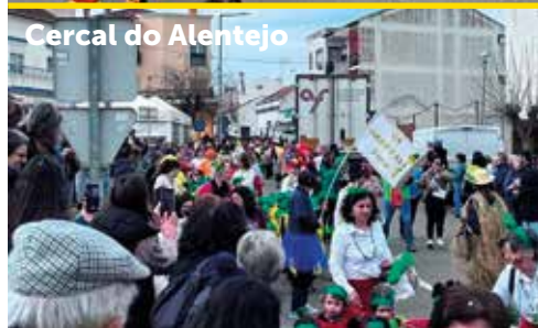
Cercal do Alentejo