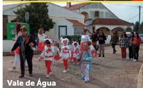
Vale de Água