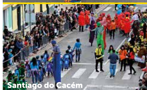
Santiago do Cacém