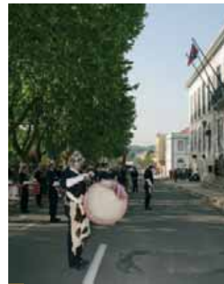
Santiago do Cacém