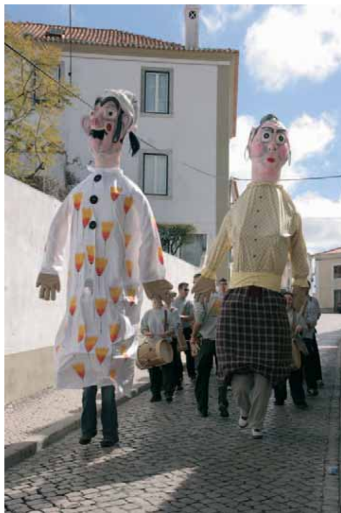
Desfile pelas ruas de Santiago do Cacém do grupo "Bordoada"