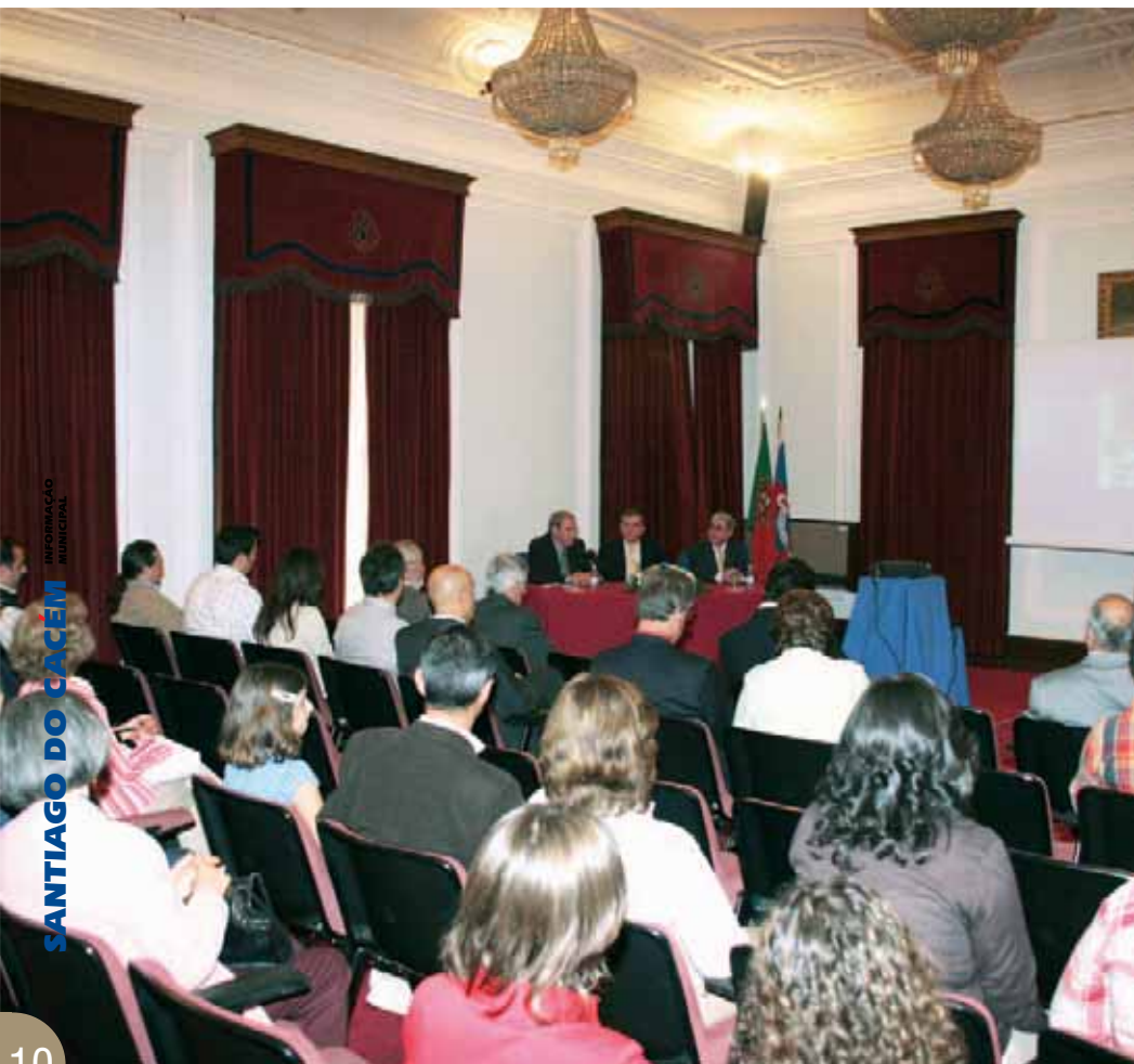
Recepção no Salão Nobre da Câmara Municipal às rádios participantes no encontro nacional da ARIC

O município de Santiago do Cacém foi o local escolhido para a realização do Encontro Nacional de Rádios da ARIC (Associação de Rádios de Inspiração Cristã), evento que decorreu nos dias 29 e 30 de Abril e que coincidiu com as comemorações do 20º aniversário da Antena Miróbriga e do 15º aniversário da ARIC.