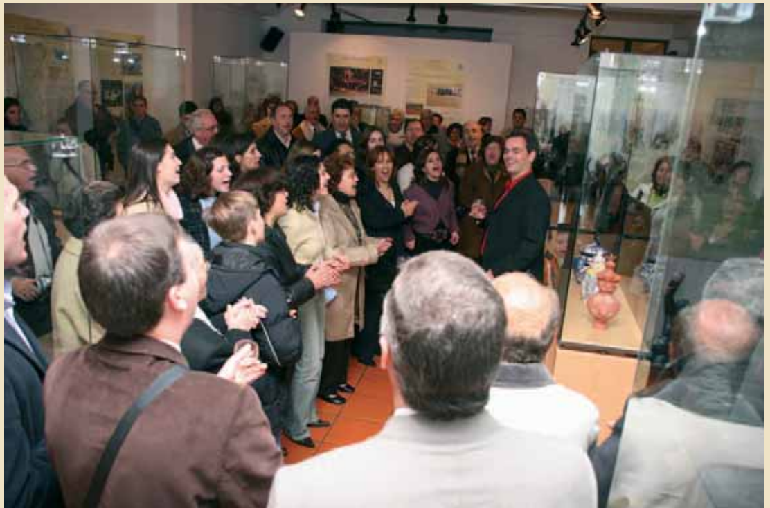
Vitalidade do Coral Harmonia representada na exposição “Afinições”