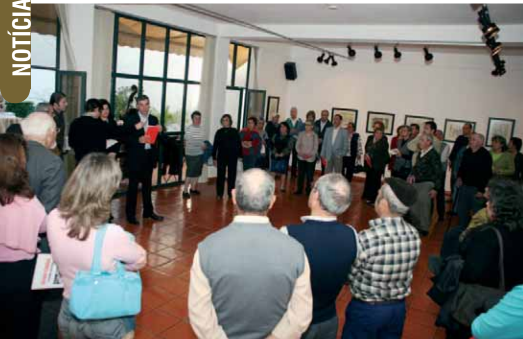
Uma exposição que despertou o interesse da população

O Museu Municipal de Santiago do Cacém expôs de 1 de Abril a 20 de Maio, na Sala de Exposições Temporárias, a colecção de 25 desenhos de Álvaro Cunhal.