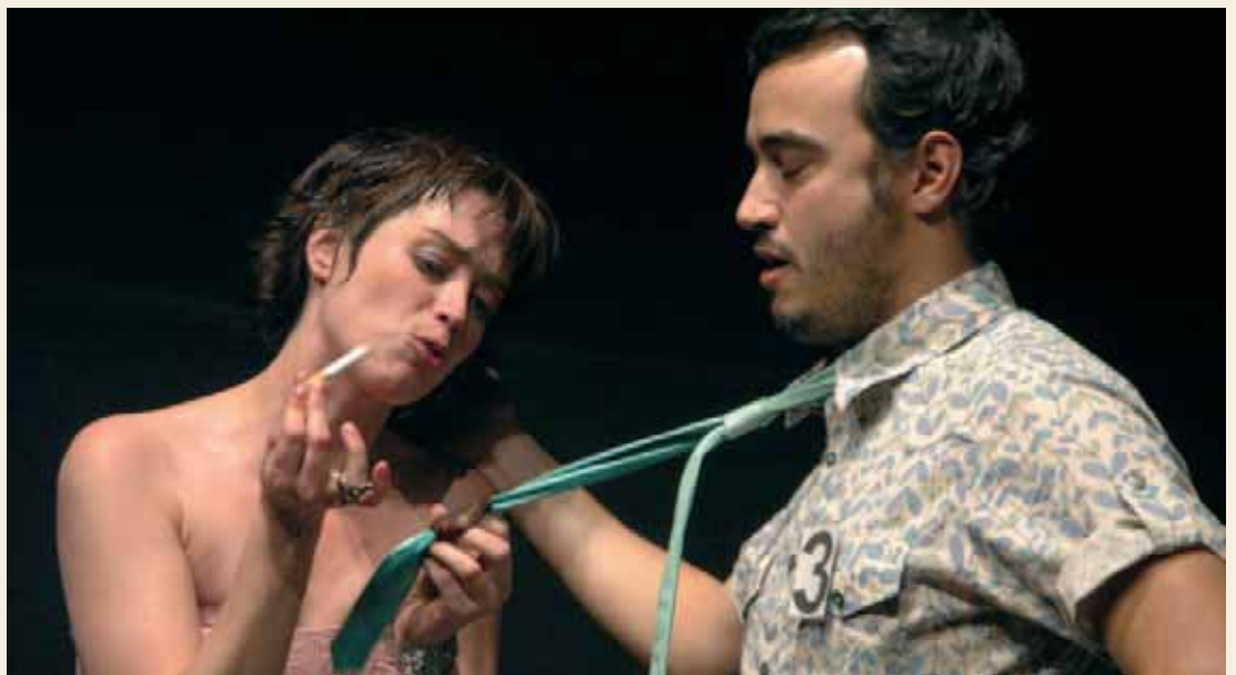
Actuação do Teatro Praga

Teatro de Santo André foi muito positivo, com a promessa de conseguir mais e melhor para as próximas edições do evento.