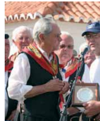
Vale de Água