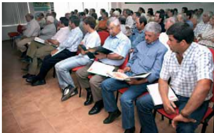
Forte presença dos agricultores

Na apresentação das conclusões do estudo, a Agro.Ges venceu que “a opção pela prática de culturas hortícolas constituirá, num futuro próximo, a única oportunidade de criação de valor acrescentado agrícola na re-