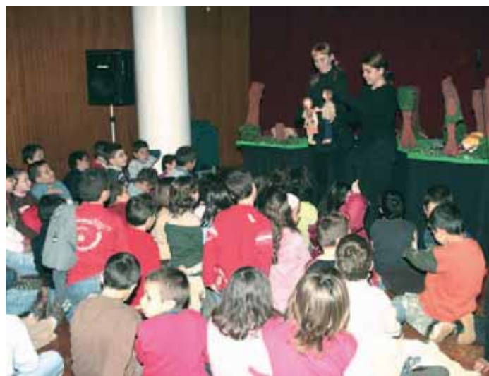
Tarde infantil com o "Teatro de Marionetas" pelo grupo Trulé

O mundo da leitura, dos livros e da animação aberto há nove anos, com a certeza da continuidade da oferta cultural a um município que já se habituou a frequentar a sua Biblioteca.