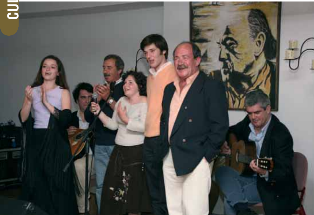
"Tertúlia Fadista" a encerrar as comemorações do 9º aniversário da Biblioteca Municipal Manuel da Fonseca

O dia 22 de Março é desde 1997 um dia de festa no município de Santiago do Cacém. O dia em que a Biblioteca Municipal Manuel da Fonseca comemora o seu aniversário. Este ano, na senda dos anos anteriores, as comemorações dos nove anos de vida da Biblioteca decorreram durante todo o mês de Março.