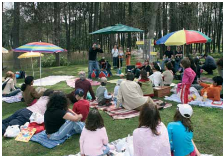
Traga almoço e "conto" connosco – iniciativa realizada no Parque Central

O Dia Internacional do Livro Infantil foi comemorado no dia 1 de Abril, em Vila Nova de Santo André, por iniciativa da Biblioteca Municipal Manuel José "do Tojal" sob o lema: "Contos Traquinas pelas Esquinas".