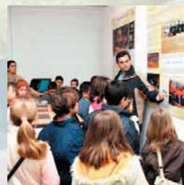
Coral Harmonia comemorou o 22º aniversário