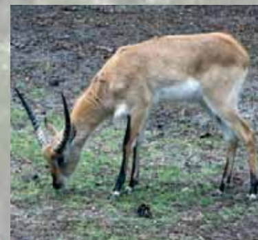
7º aniversário do Badoca Safari Park