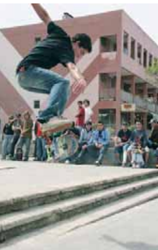
Campeonato de Street Skate no âmbito do projecto "Atreve-te"