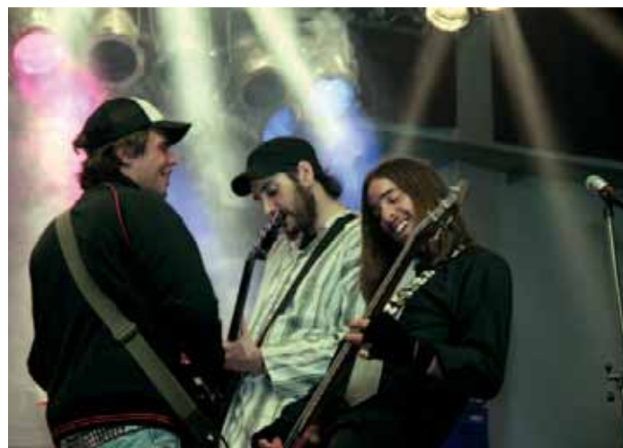
Actuação dos "Dados Viciados"