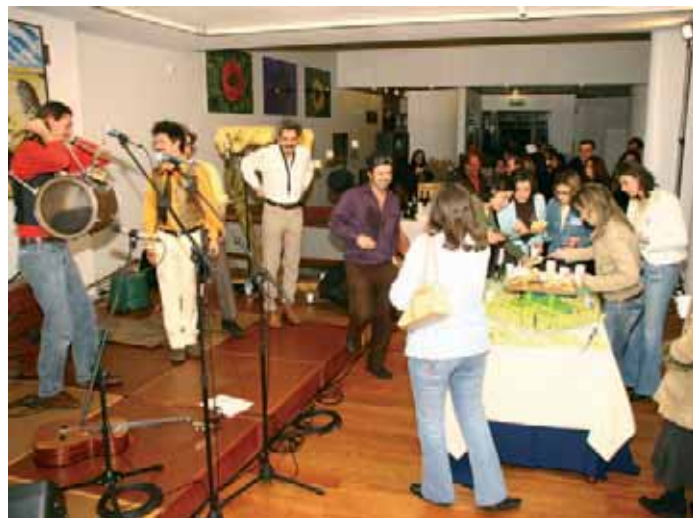
Cantaram-se os parabéns à Biblioteca Municipal