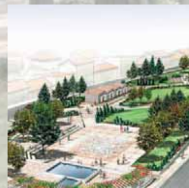
Arrancaram as obras do Parque Verde da Quinta do Chafariz