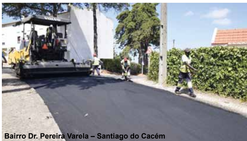
Bairro Dr. Pereira Varela – Santiago do Cacém

A Câmara Municipal está a proceder à pavimentação de várias vias municipais através de uma empreitada, a cargo da empresa Construções J.J.R. & Filhos, S. A.,