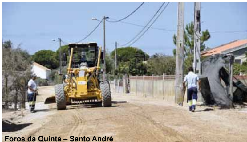
Foros da Quinta – Santo André

A Câmara Municipal está a proceder à pavimentação de várias vias municipais através de uma empreitada, a cargo da empresa Construções J.J.R. & Filhos, S. A.,