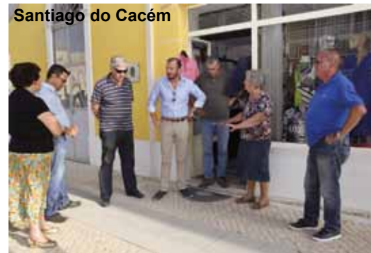
Santiago do Cacém