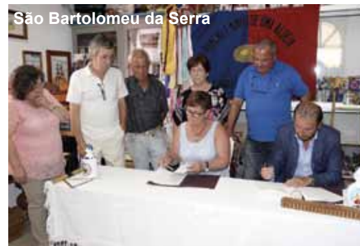
São Bartolomeu da Serra