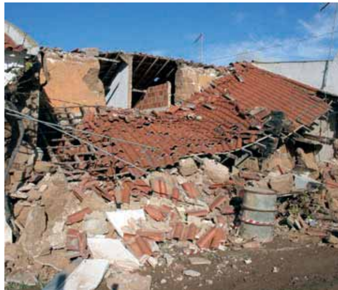
Freguesia de S. Domingos

Entretanto, a Caixa de Crédito Agrícola Mútuo de Santiago do Cacém abriu uma conta solidária com o fim de angariação de donativos para as vítimas das cheias. A este acto solidário juntou-se o mestre da guitarra portuguesa António Chainho, que realizou dois espectáculo de solidariedade, em S. Domingos e Abela.