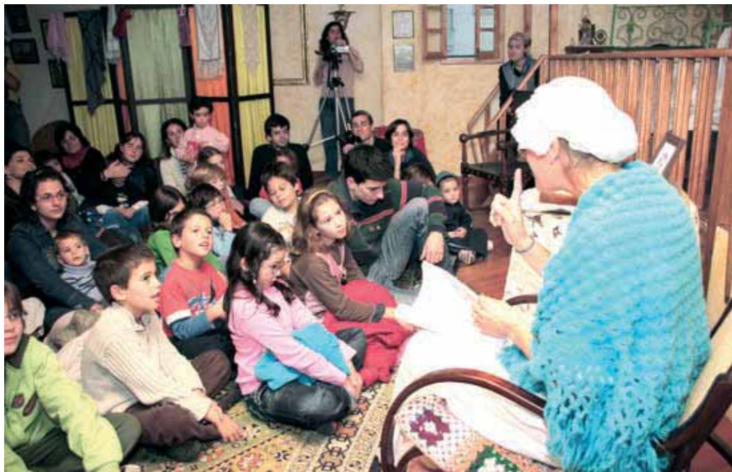
“Sótão da Avó” recriado na Biblioteca Municipal Manuel da Fonseca no espaço Hora do Conto

Todas as Terças, Quintas e Sextas, mediante marcação, aquele espaço recebe as crianças do pré-escolar e 1º Ciclo do município.