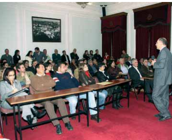
Apresentação pública do Fundo de Apoio às micro e pequenas empresas

a estimular e orientar investimentos das micro e pequenas empresas para a melhoria dos produtos e serviços prestados, para a modernização das instalações e equipamentos ou para as modificações decorrentes de imposições legais e regulamentares a que as mesmas estão sujeitas. O Fundo aplica-se à área geográfica do Concelho de Santiago do Cacém e a projectos de investimentos nos sectores da Indústria, agricultura, comércio, turismo, construção e serviços