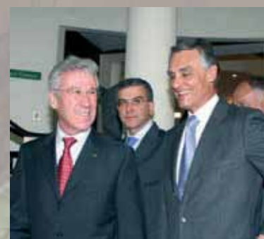
Presidente da República em Santiago do Cacém