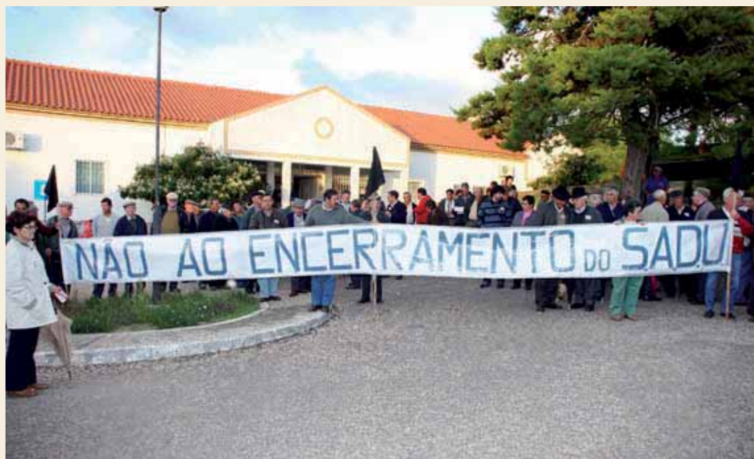
Utentes exigiram medidas de forma a proporcionar uma assistência médica condigna

A moção foi aprovada durante a concentração organizada pelas Comissões de Utentes do Concelho, com o apoio das autarquias locais que juntou, no dia 16 de Novembro, frente ao SADU de Santiago do Cacém perto de três centenas de pessoas. Durante a concentração os utentes daquele serviço manifestaram total desacordo pelo encerramento do SADU e exigiram a adopção de medidas de forma a proporcionar uma assistência médica condigna e a tomada de medidas para pôr a funcionar as valências do Hospital do Litoral Alentejano, entre as quais a maternidade. José Ferro, porta-voz das Comissões de Utentes dos Serviços Públicos informou que Setúbal é o distrito mais carenciado em termos de cuidados de saúde e Santiago do Cacém é o segundo concelho mais problemático. Com 31 mil habitantes há 16