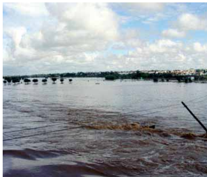
Freguesia de Alvalade