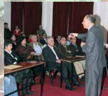
Apoio financeiro a projectos de micro e pequenas empresas