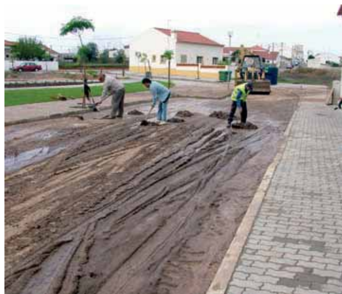
Freguesia de Ermidas