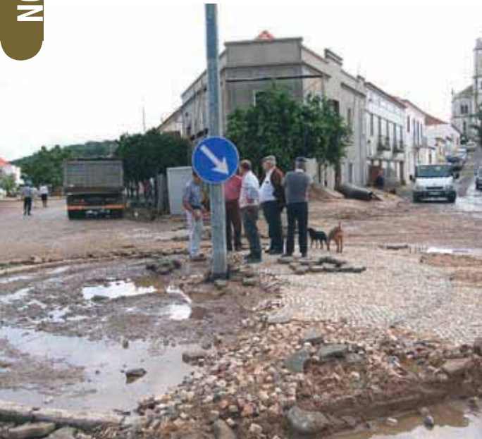
Freguesia de Abela

A chuva intensa e o vento forte que atingiram o município de Santiago do Cacém durante os dias de 3 e 4 de Novembro causaram inundações, aluimentos de terra, propriedades agrícolas devastadas, danos em infra-estruturas, estradas, caminhos e pontões.