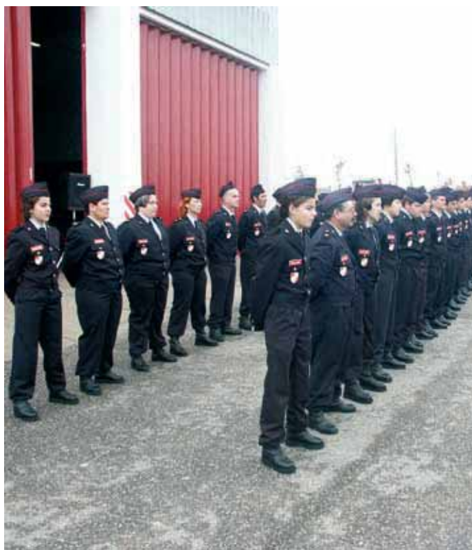
Bombeiros Voluntários de Alvalade

bombeiros de Alvalade; a participação da Fanfarra da Amadora; a mostra de viaturas, aberta à população.