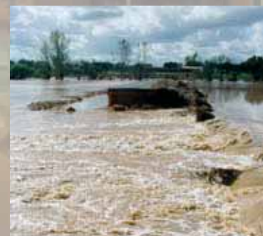
Mau tempo provoca prejuízos em cerca de 2,5 milhões de euros