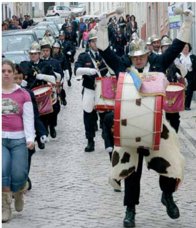
Desfile da Fanfarra dos Bombeiros Voluntários de Santiago do Cacém

Do programa das comemorações destaque para a inauguração do símbolo do Bombeiro feito em granito e idealizado por dois