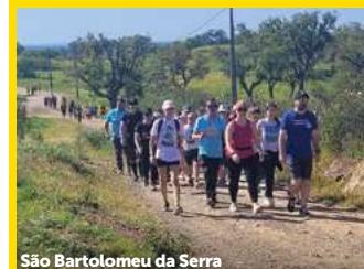
São Bartolomeu da Serra