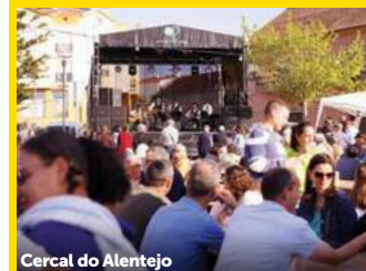
Cercal do Alentejo