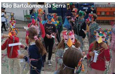
São Bartolomeu da Serra