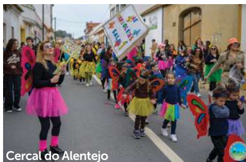
Cercal do Alentejo