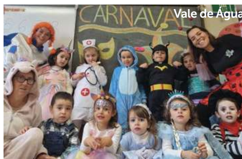
Vale de Água

As ruas do Município de Santiago do Cacém encheram-se de animação e cor nos Desfile de Carnaval das Escolas. As crianças, educadoras, professores, auxiliares, animadoras demonstraram boa disposição, originalidade e criatividade. Os mais pequenos saíram para a rua nos desfiles do Carnaval das Escolas. Por todas as Freguesias os tradicionais