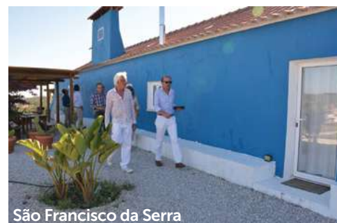
São Francisco da Serra