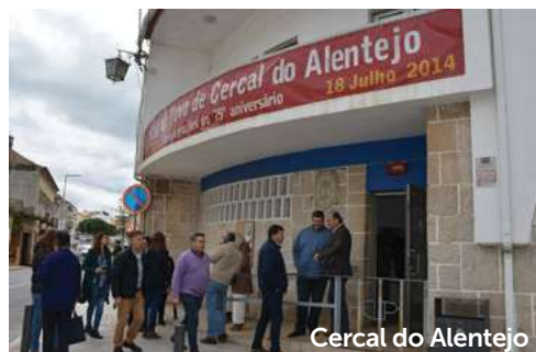
Cercal do Alentejo