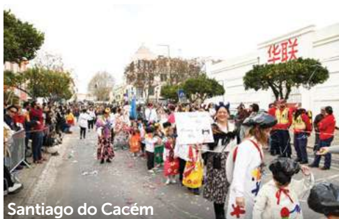
Santiago do Cacém