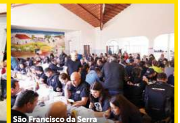
São Francisco da Serra