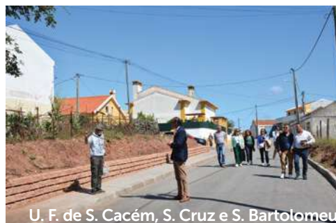
U. F. de S. Cacém, S. Cruz e S. Bartolomeu