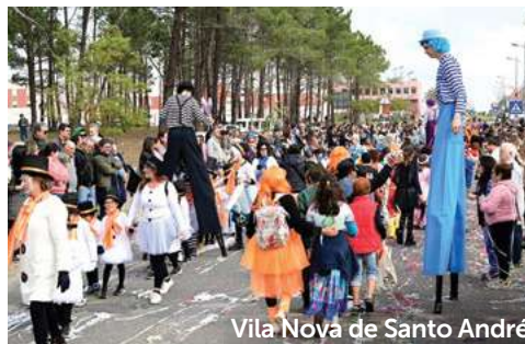
Vila Nova de Santo André